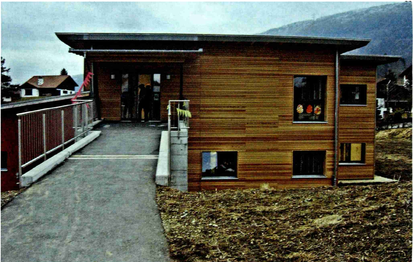
Maison de l'enfance de Malleray chauffée à partir de l'installation de chauffage central à distance à copeaux de la halle de gymnastique.