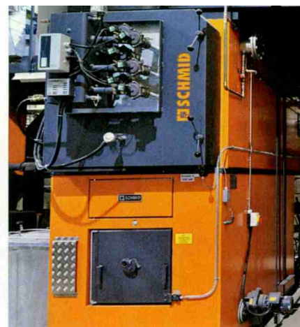
Schmid Feuerungen stehen weltweit im Einsatz