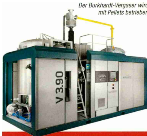
Der Burkhardt-Vergaser wird mit Pellets betrieben