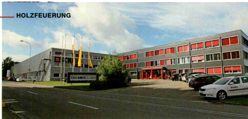
Hauptsitz in Eschlikon, Thurgau

Themen-Nr.: 678.006 Abo-Nr.: 1077600 Seite: 24 Fläche: 52'983 mm 2