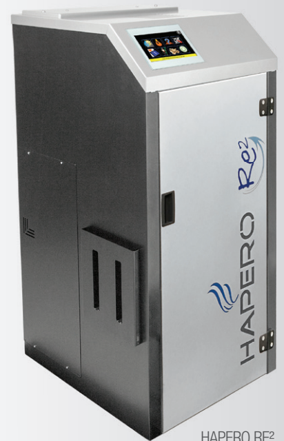
HAPERO RE 2