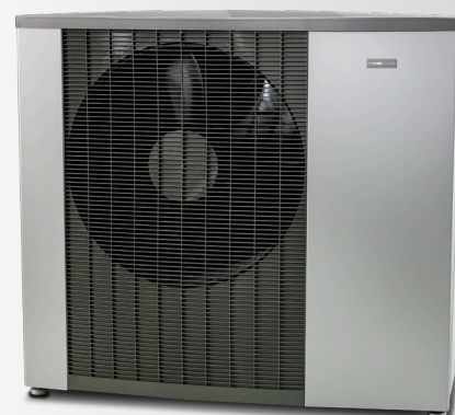
NIBE F2120-16 / F2120-20