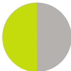
100-kW-Anlage ca. CHF 36'000.-

Die Klimaprämie fällt insbesondere für grössere Anlagen sehr grosszügig aus; bei einer 500-kW-Anlage kann der Förderanteil 2) fast die gesamte Investition abdecken :