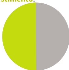
Impianto da 100 kW ca. CHF 36 000.-

Il premio clima è particolarmente generoso per gli impianti di grandi dimensioni; per un impianto da 500 kW, la quota contributiva 2) può coprire quasi l'intero investimento: