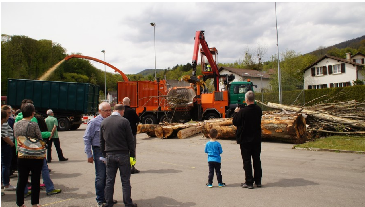
Schaulustige verfolgen die Holzschnitzelzubereitung.

Zuletzt aktualisiert am 2.5.2016 um 13:05 Uhr