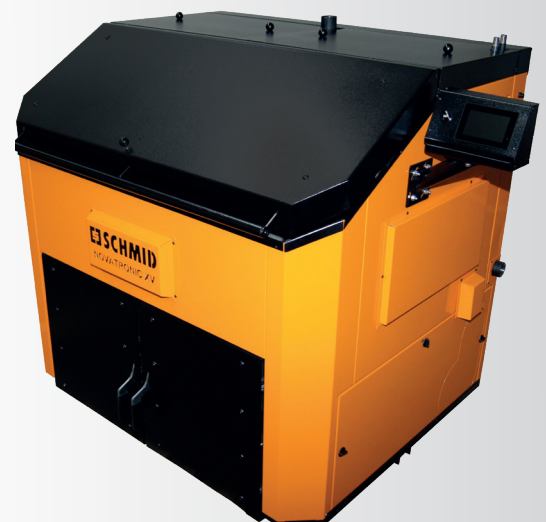
NOVATRONIC XV 80/50