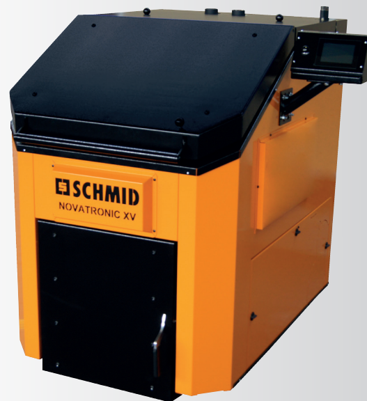
NOVATRONIC XV 55/35