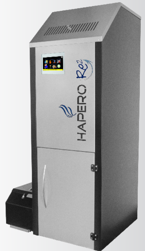
HAPERO RE 2 25